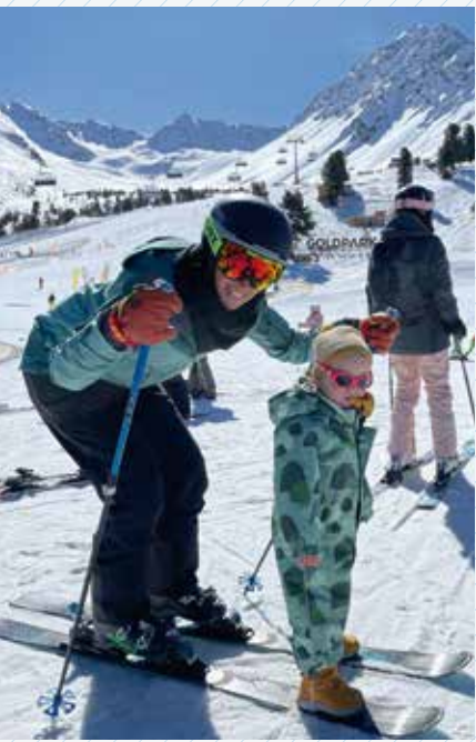
Früh übt sich: Diesen Winter ruft dann erstmals die Skischule.