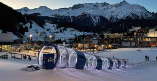
Die 16.000 qm große Winter.Wunder.Welt am Schloss Naudersberg sorgt auch nach Liftschluss für Schneespaß für die ganze Familie.

Luis: Restaurant, Pizzeria, Bar – das Luis bringt gemütliches urbanes Flair nach Nauders! Die kulinarischen Höchstleistungen lassen die Herzen von Genussliebhabern höherschlagen. Egal ob ein saftiges Steak oder eine Pizza, hier schmeckt einfach alles super! www.luis-nauders.at Zum Goldenen Löwen: Im familiären Gasthof gibt es liebevoll zubereitete Spezialitäten nur mit Zutaten aus Österreich. Und beim Absacker an der Bar trifft man auf den einen oder anderen Einheimischen. www.loewen-nauders.com