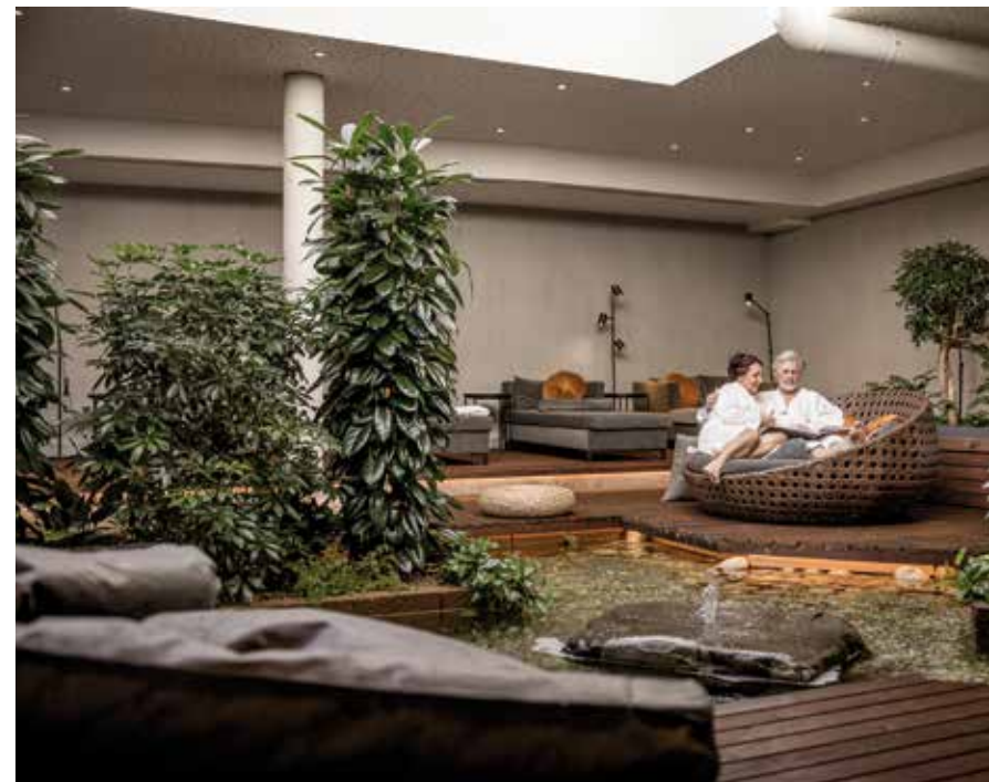
Wohlfühloase im Ortskern: Im Alpin Art & Spa Hotel Naudererhof können Eltern im Indoor-Wellnessgarten entspannen oder sich kulinarisch verwöhnen lassen, während sich die Kleinen im Pool oder in der Kletter- und Trampolinhalle auspowern.