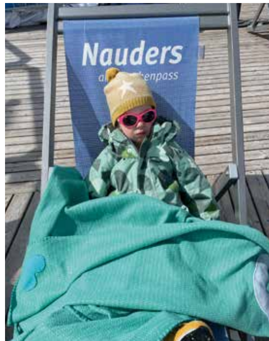
Vollkommene Glückseligkeit: Skikindergarten, Kinderland, Sonnenterrasse – auch eine Zweijährige kann den Winterurlaub ohne Skifahren in vollen Zügen genießen.

gebürtige Freiburgerin und Sebi lieben die Berge, waren aber noch nie an Ostern Ski fahren. Im Vorfeld waren sie skeptisch, ob die Bedingungen im April noch Fahrspaß bringen. An Weihnachten haben sie in Chamonix ein trauriges Schnee-Fiasko erlebt, jetzt sind sie nach den ersten Tagen voll überzeugt. Angenehme Temperaturen, toll präparierte Pisten, die nachmittags gar noch zur Talabfahrt taugen, viel Sonne – und die Chance, gemeinsam Zeit auf der Piste zu genießen. Und am vorletzten Tag gibt's noch über Nacht feine 30 Zentimeter Neuschnee. Staubender Powderspaß im April!