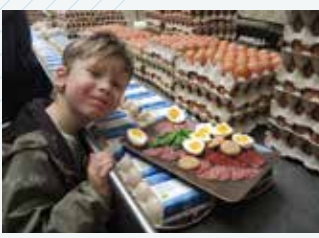
Lecker: Am Becka Hof gibt's Bio-Eier und -Salami sowie Eierlikör.