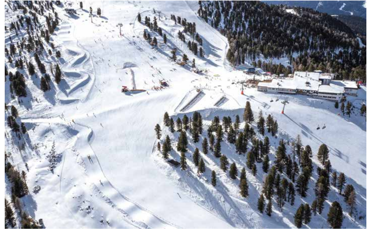
Das neue Skiareal Goldpark an der Bergstation mit Skischulbereichen, Snow-Base Bergkastel, Fun Line, Goldseebahn und Nauderixland mit Kinderrestaurant bietet nicht nur familienfreundliche Schnee-Erlebnisse, sondern auch ganztägige Kinderbetreuung – das macht Eltern happy!