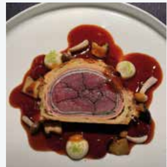
Solche Leckereien gibt's im „s'kammerli“ im Hotel Central.

Holen Sie sich den Pistenplan per QR-Code aufs Handy!